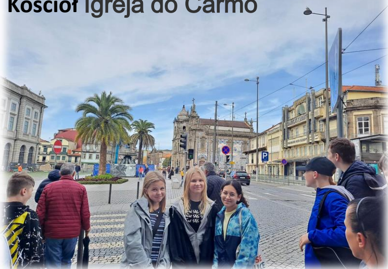
Kościół Igreja do Carmo