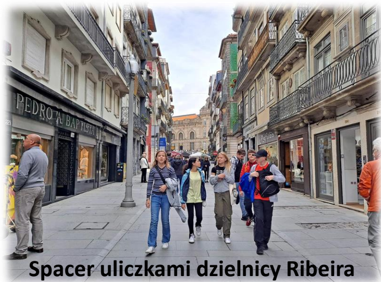
Spacer uliczkami dzielnicy Ribeira