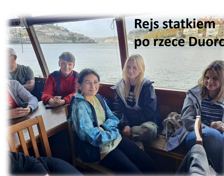
Rejs statkiem po rzece Duoro